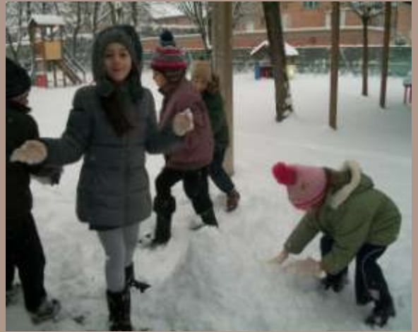
Prato in inverno