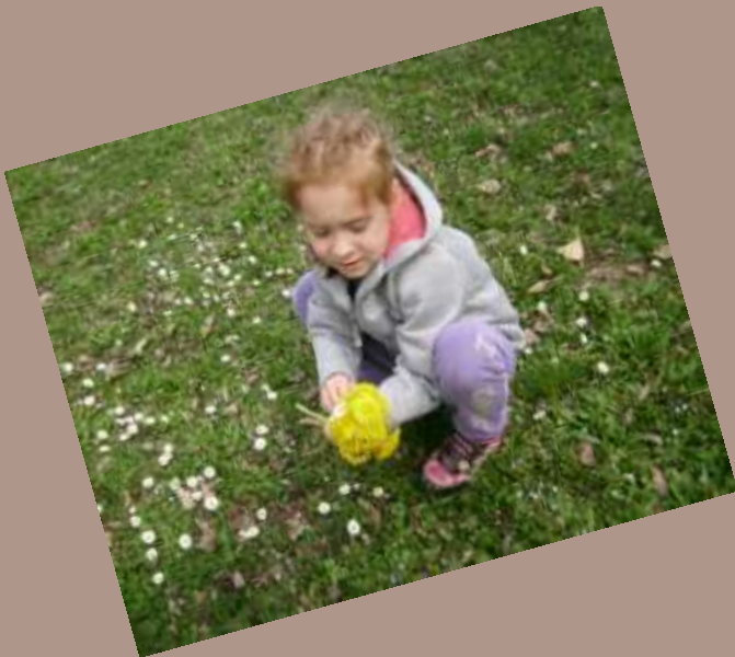
Prato in primavera