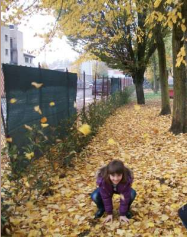
Prato in autunno